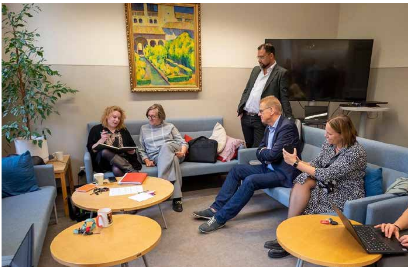
Rektorer från Nederländerna på besök