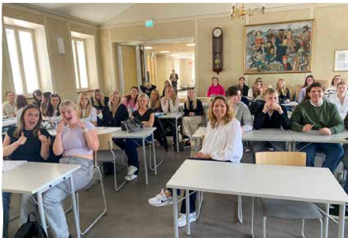
Gästerna var glada och trivdes mycket bra i Åbo, som de tyckte var väldigt lik en vanlig svensk stad.