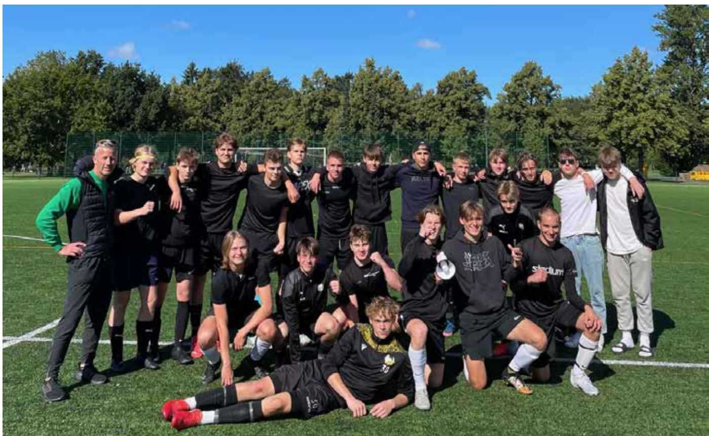
Kattans fotbollslag vann fotbollsturnering mellan Åbogymnasierna hösten 2022