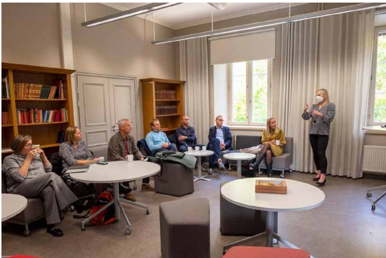
Bildtext: Lärare från Nyköping på besök