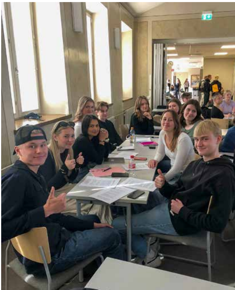
Bildtext: Gruppuppgifterna gick riktigt bra och alla var på glatt humör.

Mätta och belåtna fortsatte de flesta av oss att umgås utepå stan. Åstrandens som badade i en mild kvällssol var utmärkt för detta. Ett och annat inköp gjordes också i Hansakvarteret. Vi studerande i Katedralskolan beundrade våra gästers engagemang och öppenhet. Det fanns ett genuint intresse gentemot varandra, och en god stämning rådde under hela konferensen. Utåtvändhet hörde till våra fördomar om svenskarna, kanske det låg något i det? Vi uppskattade alltså starkt våra gästers positiva attityd och utmärkta sociala färdigheter. Många bekanskap stiftades under kvällen, men notiden blev det dags att ta sig hemåt.