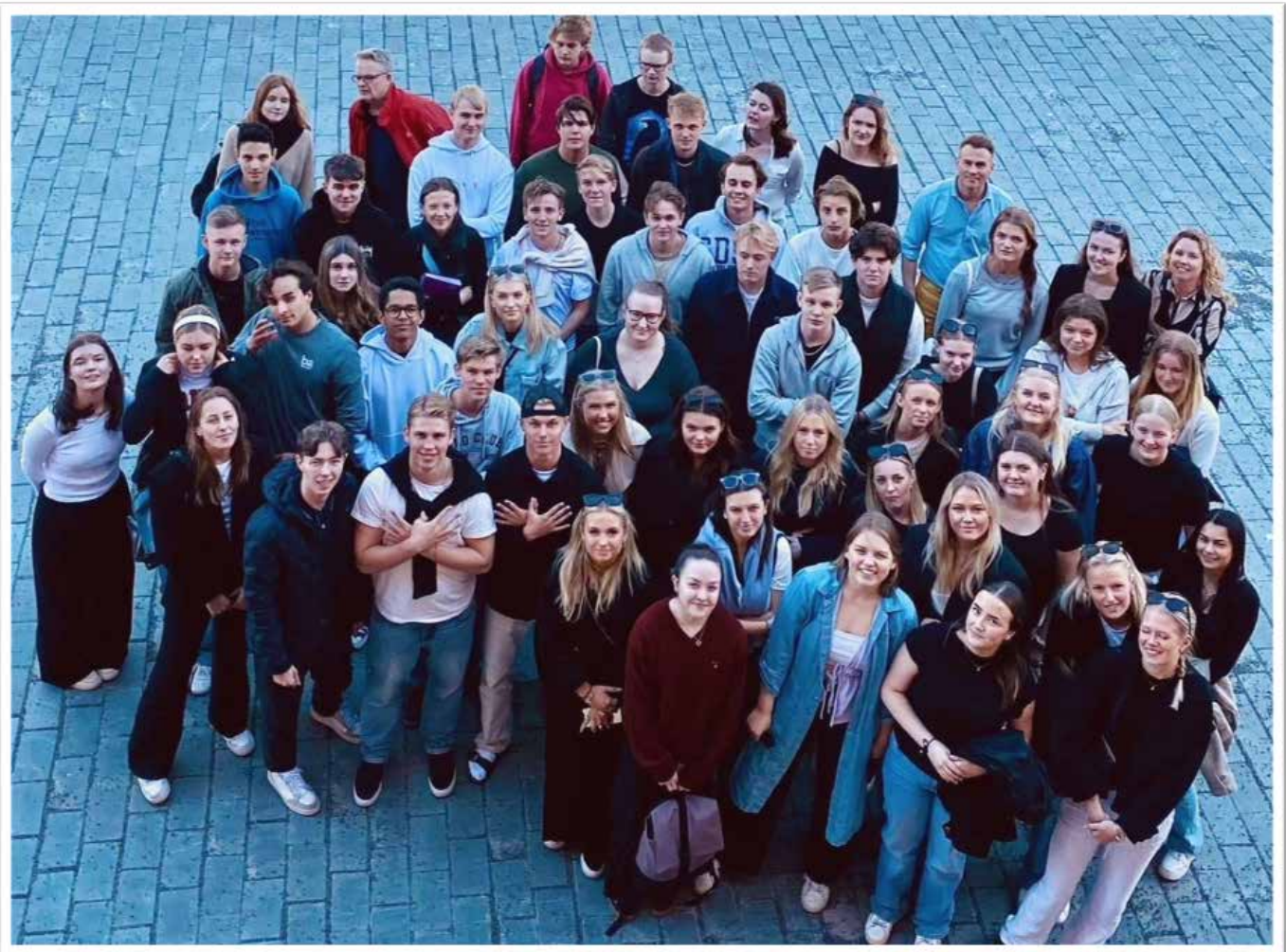
Bildtext: Gruppfoto på deltagarna