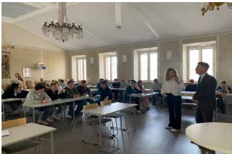
Bildtext: Torsdagen började med att vi lärde känna varandra lite och diskuterade möjliga fördomar om varandra.