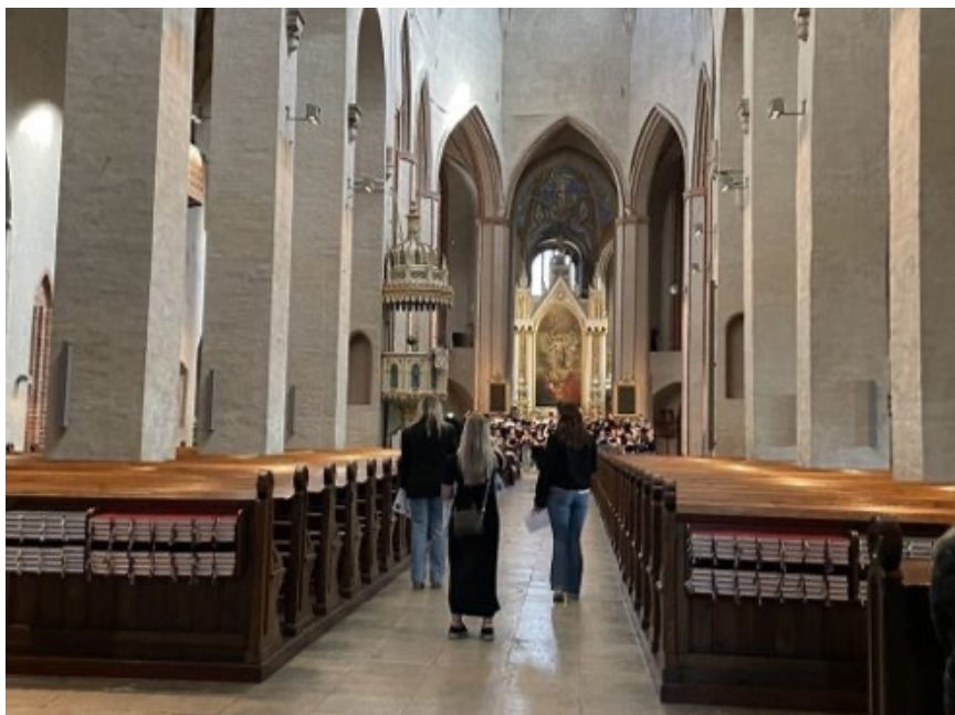
Bildtext: Besök till Åbo domkyrka, samt en sista gruppbild före svenskarnas hemfärd

(Utarbetat av Kia Österholm, Tor Nylund, Tyko Gustafsson, Stella Suojanen, Mathilda Gustafsson, Anna Södergård och Melinda Eriksson.)