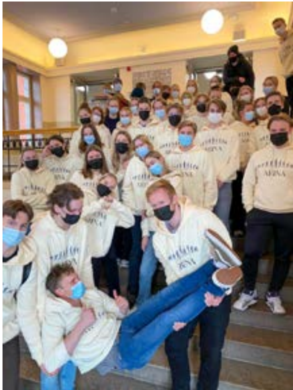
En hop glada och uppspelta abiturienter fotograferade i trappan under sin sista officiella skoldag innan utvärderingsveckan började.

Munskydd hörde till den mer eller mindre obligatoriska utstyrsel läsåret 2021-2022. På grund av pandemin kunde bänkskuddardagen inte firas i februari, utan blev uppskjuten till 1 april.