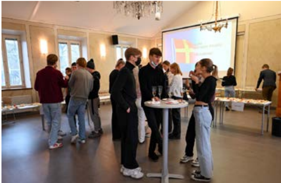
Mingel på svenska dagen