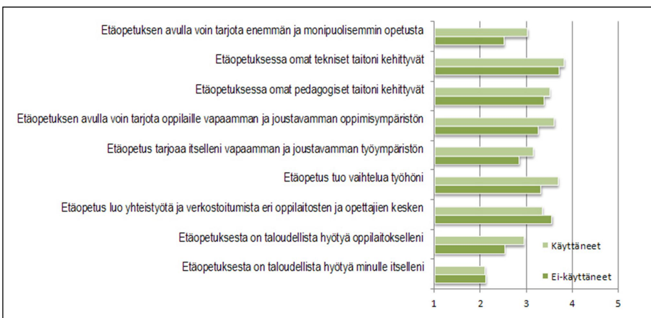
Kuvio 1. Miten etäopetukseen suhtaudutaan? (1=en ollenkaan samaa mieltä, 5=täysin samaa mieltä) (n=2400)

Tutkimuksessa haluttiin selvittää, millä tavoin opettajat suhtautuvat etäopetukseen. Samat kysymykset kysyttiin sekä niiltä, jotka ovat opettaneet etänä että niiltä, jotka eivät ole opettaneet etänä. Tulosten mukaan etänä opettaneilla on yleisesti ottaen positiivisempi näkemys etäopetuksesta, kuin niillä opettajilla, jotka eivät ole opettaneet etänä (Kuvio 1). Ryhmien väliset erot olivat tilastollisesti merkitseviä jokaisen väittämän kohdalla ( p < .001 ).