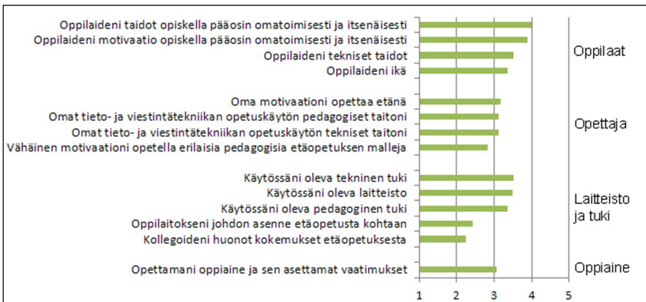
Kuvio 4. Kuinka rajoittavana tekijöinä opettajat pitävät ko. asioita, jos he käyttäisivät etäopetusta työssään (1=ei ollenkaan rajoittava, 5=erittäin rajoittava) (n=1985)

Tutkimuksessa haluttiin selvittää tekijöitä, jotka rajoittavat opettajien etäopetuksen käyttöä omassa opetuksessaan. Niitä opettajilta, jotka eivät ole opettaneet etänä kysyttiin, kuinka rajoittavana tekijöinä he pitäisivät eri asioita etäopetuksen toteuttamisessa, jos opettaja käyttäisi etäopetusta työssään (Kuvio 4).