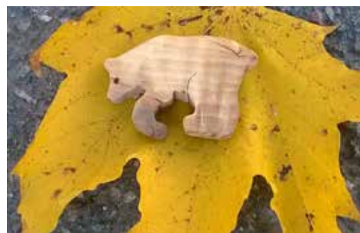
Irenen Tenjoelta tuoma karhunkynsi-patavahti.

Sekoita täyteen mascarpone, rahka, munat, sokeri, vanilliinisokeri ja kohmeiset puolukat keskenään. Nostele täyte pohjan päälle ja tasoita pinta. Paista piirakkaa 175 asteessa uunin alimmalla tasolla noin 55 minuuttia. Tarjoa jäähtyneenä.