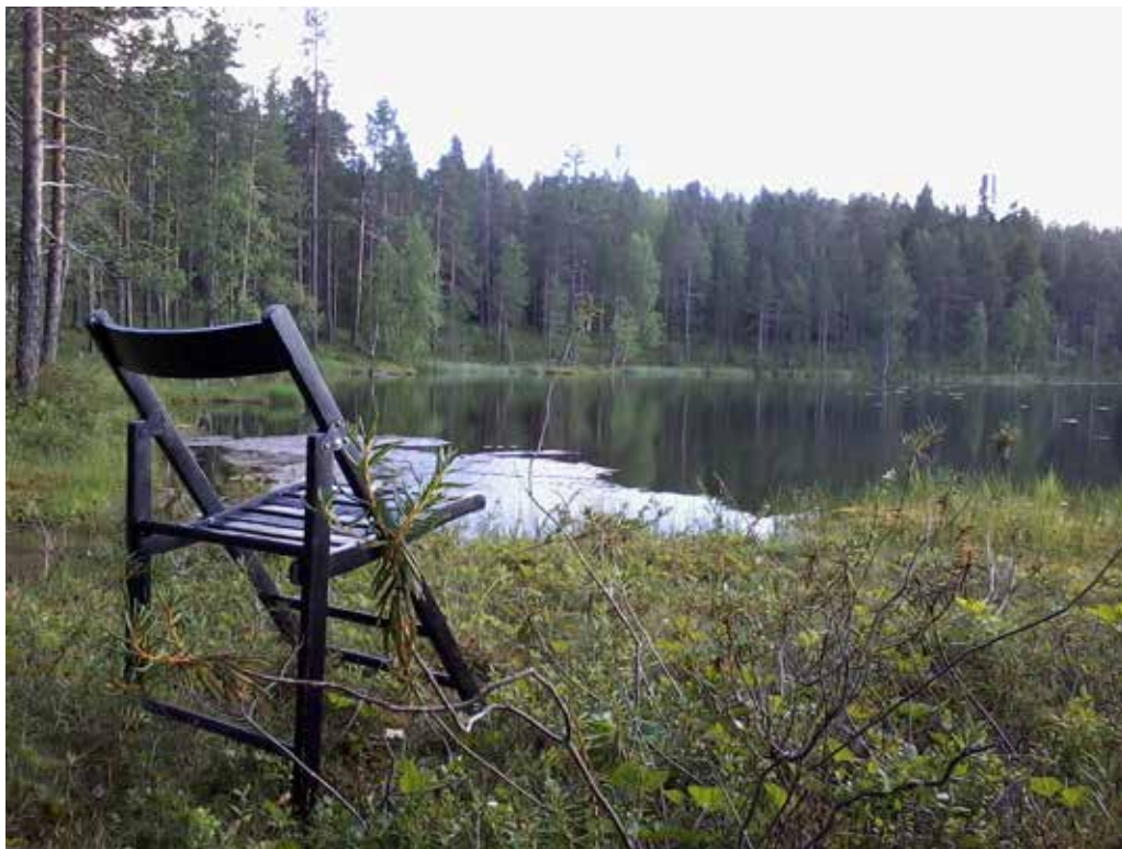
Meditaatiota voisi kutsua ”tyhjänä istumisen taidoksi”, sanoo Meditaatio ja itsetutkimus -kurssin opettaja Turo Vuorenpuuro.

Haastattelu: Pirjo Haapala