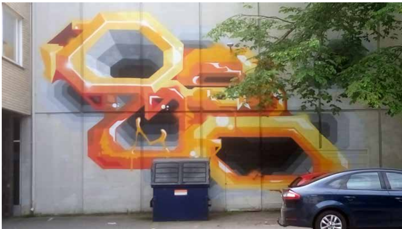
Turkulaiset taiteilijat "OSMO", JUKKA HAKANEN ja "LEVEL II CREW" toteuttivat syksyllä 2016 Turun nuorisotyön 70-vuotisjuhlan murallit. Osoitteessa Kaskenkatu 5 on yksi niistä.